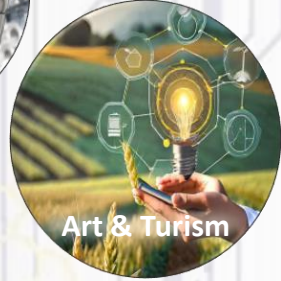
Art & Tourism